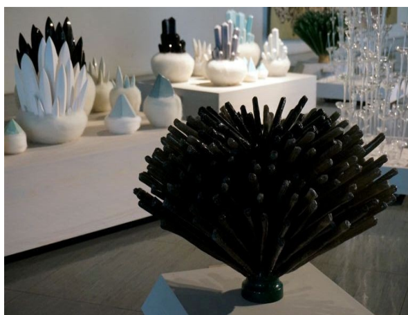
Installation Le jardin des retours, 2012-2013