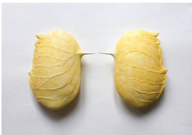
Esprit Mangue , 2014, Porcelaine, deux pièces : 26 x 22 x 7 cm, chacune, © Xue Sun

Sèvres – Cité de la céramique remercie Eric Mircher ainsi que les collectionneurs privés qui ont généreusement prêté des pièces de Xue Sun pour l'exposition.