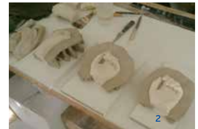
1, 2 « Projet pour la Maladrerie Saint-Lazare, 2016 »